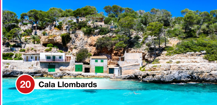
20 Cala Llombards