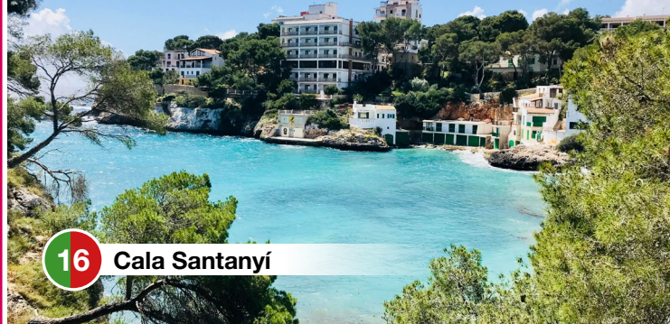
16 Cala Santanyí