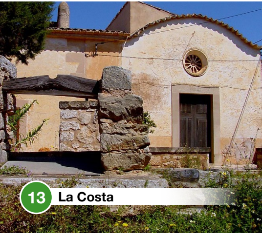
13 La Costa