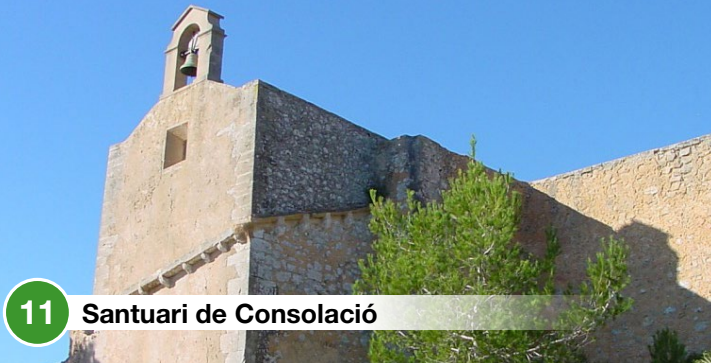
11 Santuari de Consolació