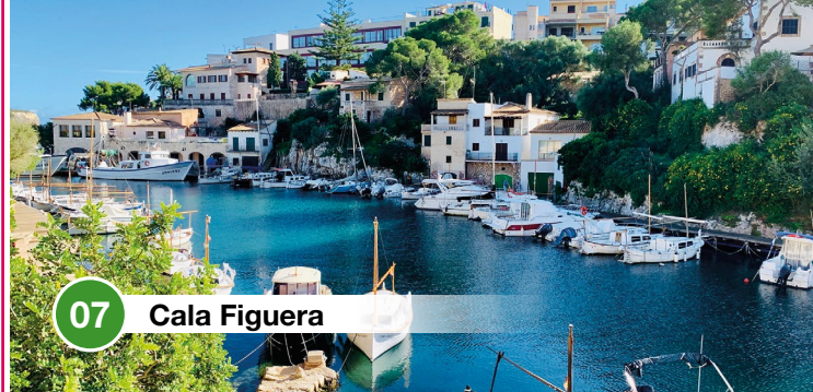
07 Cala Figuera