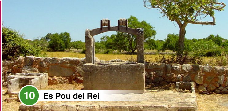
10 Es Pou del Rei