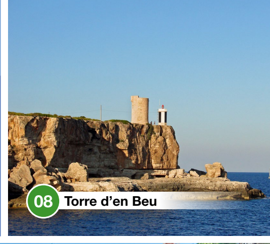
08 Torre d'en Beu