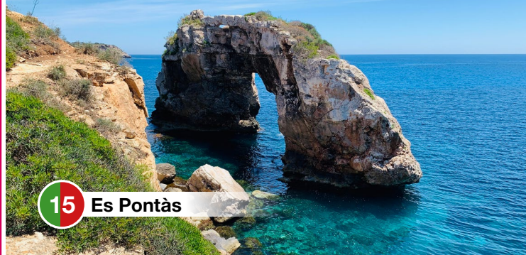
15 Es Pontàs