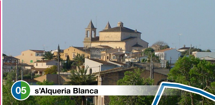
05 s'Alqueria Blanca