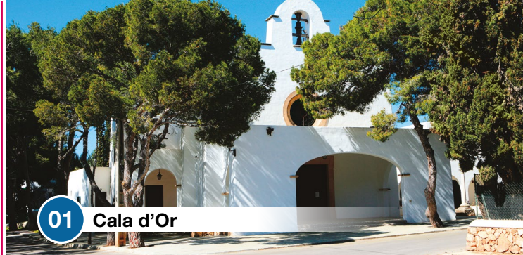
01 Cala d'Or