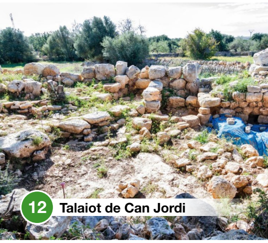
12 Talaiot de Can Jordi