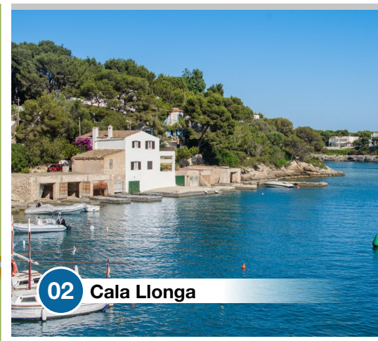
02 Cala Llonga