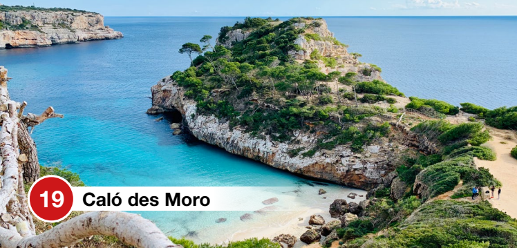
19 Caló des Moro