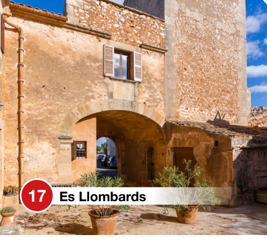
17 Es Llombards